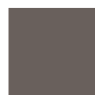
RAL: 7016 anthrazitgrau