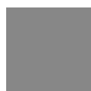
RAL: 7030 steingrau