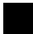
RAL: 9005 tiefschwarz