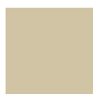
RAL: 1001 beige