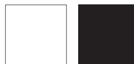
RAL: 9010 reinweiß

Farbabweichungen sind drucktechnisch bedingt.